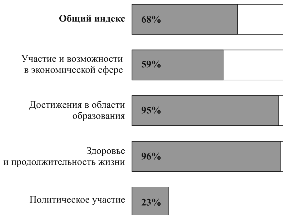
Рис. 1. Глобальный индекс гендерного неравенства – 2016 [12, с. 8].

состоянию на 2016 г. на основе анализа данных из 144 стран 16 общий показатель (сводный индекс) составил 68%, а значения четырех субиндексов варьировали от 23 до 96% (рис. 1).